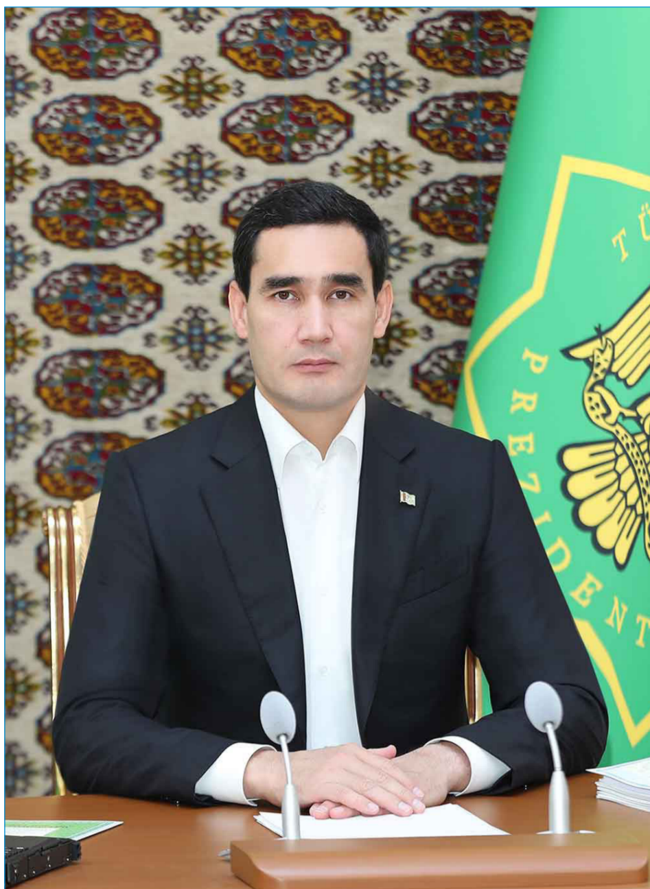
(Başlangyjy 1-nji sahypada).

möhüm wezipelere ünsi çekip, ýurdumyzda milli kadalaşdyryjy hukuk namalarynyň takyk hem-de gysarnyksyz ýerine ýetirilmegini berk gözgeçilike saklamagy tabşyrdy.