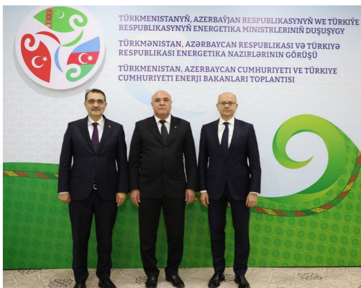
TÜRKMENISTANYŇ, AZERBAÝJAN RESPUBLIKASYNYŇ WE TÜRKIÝE RESPUBLIKASYNYŇ ENERGETIKA MINISTRLERINIŇ DUŞUŞYGY TÜRKMENISTAN, AZERBAÝJAN RESPUBLIKASI VE TÜRKIÝE RESPUBLIKASI ENERGETIKA NAZIRLARINIŇ GÖRÜŞÜ TÜRKMENISTAN, AZERBAÝJAN CUMHURİYETI VE TÜRKIYE CUMHURİYETI ENERJİ BAKANLARI TOPLANTISI

dolandyryş edaralarynyň we ugurlaryny giňeltmek Taraplar bu ulgamda ýolbaşçylarynyň duşuşygy üstünlikli durmuşa geçirilýän hyzmatdaşlygy giňeltmek üçin geçirildi. Onda energetika energetika strategiýasynyň açylýan uly mümkinçilikleriň ulgamynda gatnaşyklary esasy ugurlarydyr. hukuk kadalaryna, birek-ösdürmek bilen bagly meselelere Ýurdumyzyň elektrik birege hormat goýmaga garaldy. energetikasy pudagyny hem-de özara bähbitleri