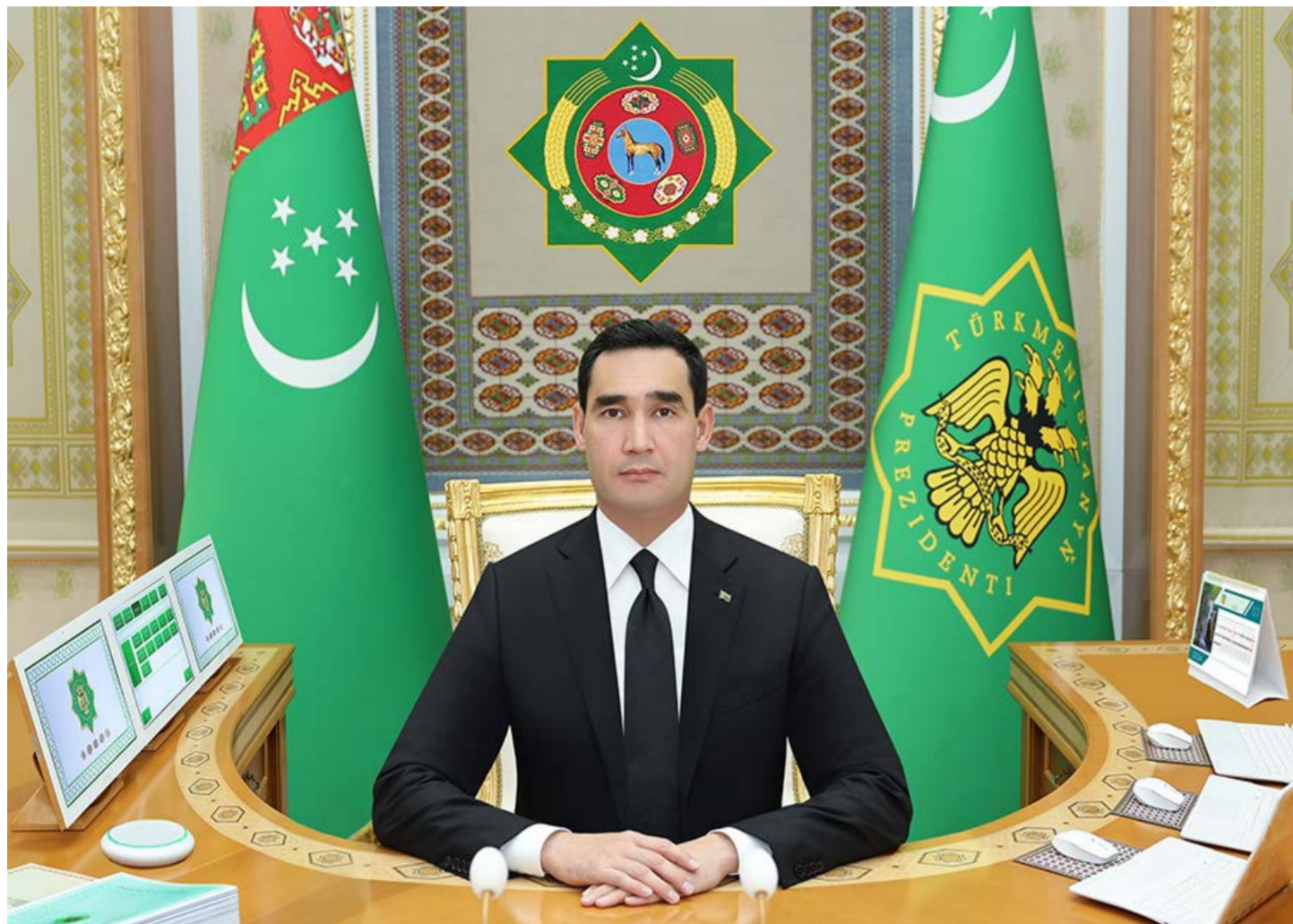
26-njy iýulda hormatly Prezidentimiz Serdar Berdimuhamedow sanly ulgam arkaly Ministrler Kabinetiniň nobatdaky mejlisini geçirdi. Onuň gün tertibine döwlet durmuşynyň birnäçe meseleleri girizildi.

Ilki bilen, Mejlisiň Başlygy D.Gulmanowa çykyş edip, döwlet durmuşynyň dürli ulgamlaryny kanunçylyk taýdan üpjün etmek boýunça alnyp barylýan işler barada maglumat berdi.