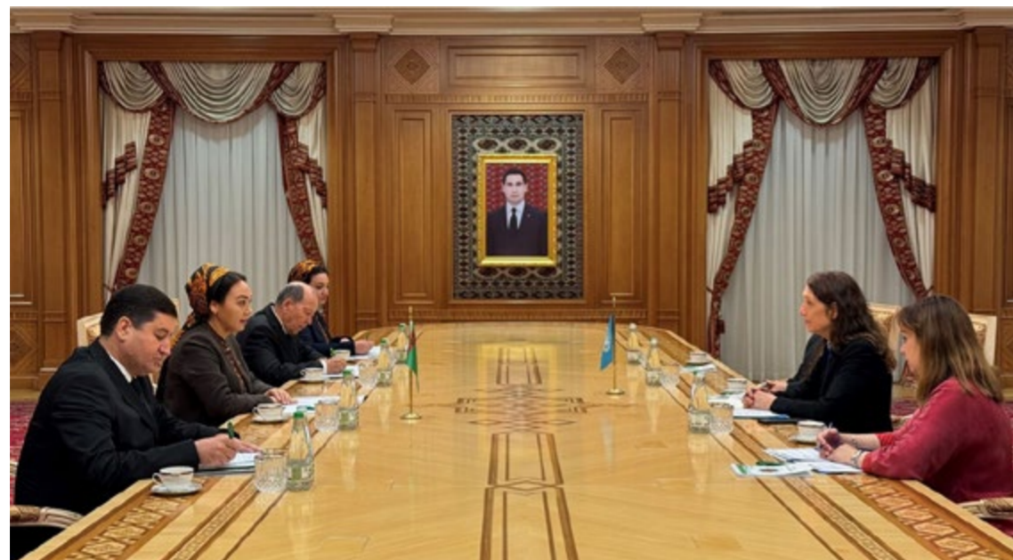
29 мая 2024 года Председатель Меджлиса Туркменистана Д.Гулманова провела встречу с Региональным представителем Управления Верховного Комиссара ООН по правам человека для